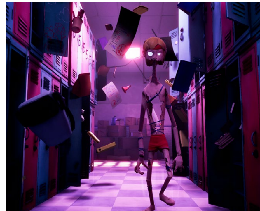
"NOX" (PC), ganador del premio al Mejor Arte en la edición 2022 de los PlayStation Awards.