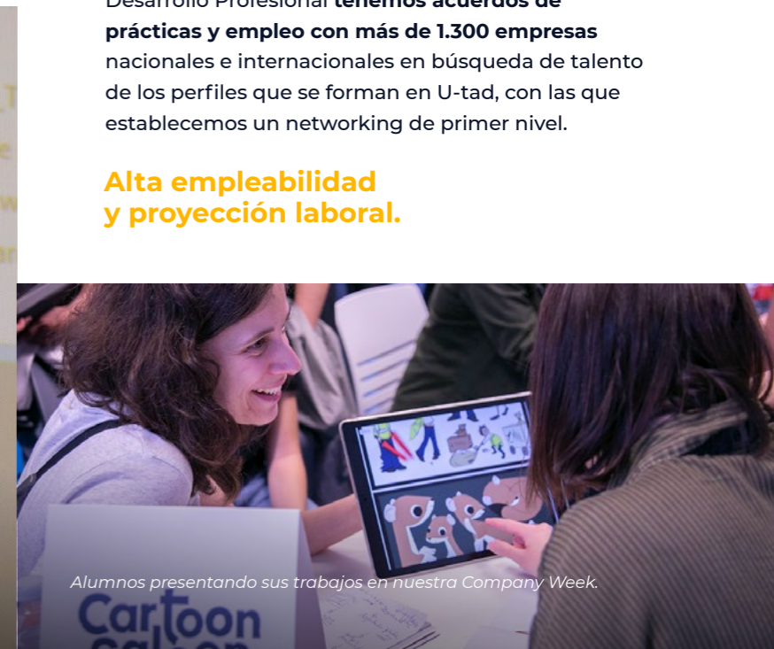
Alumnos presentando sus trabajos en nuestra Company Week.