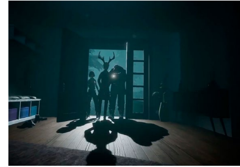
"Intruders: Hide and Seek" (PlayStation VR): proyecto de postgrado donde han participado alumnos de Arte, Videojuegos y Animación.