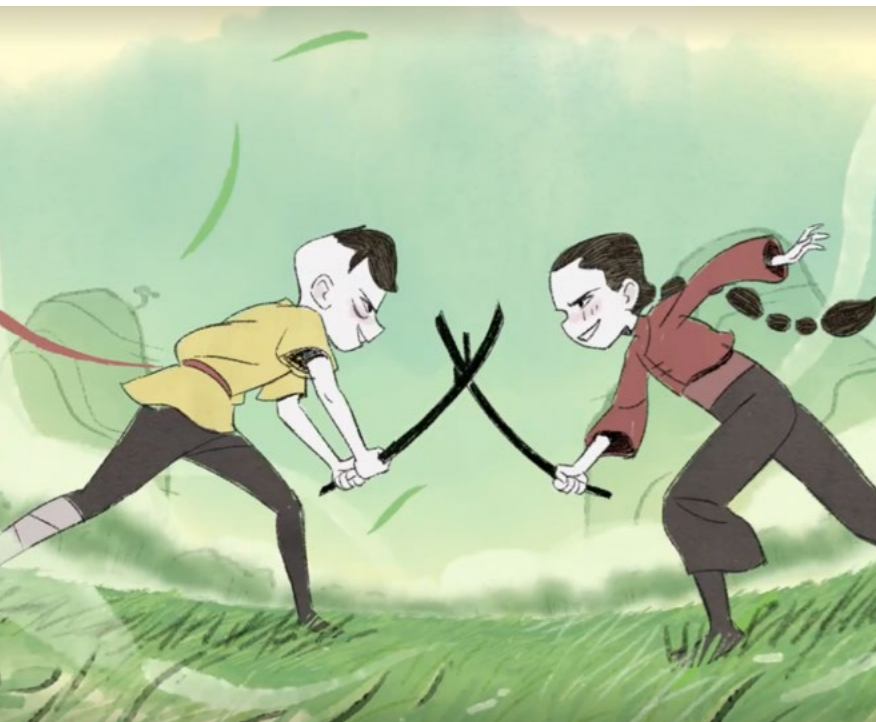
Cortometraje "Lágrimas de Dragón" , ganador del premio del público en el Festival BAMI, de Lake Jackson, Texas.