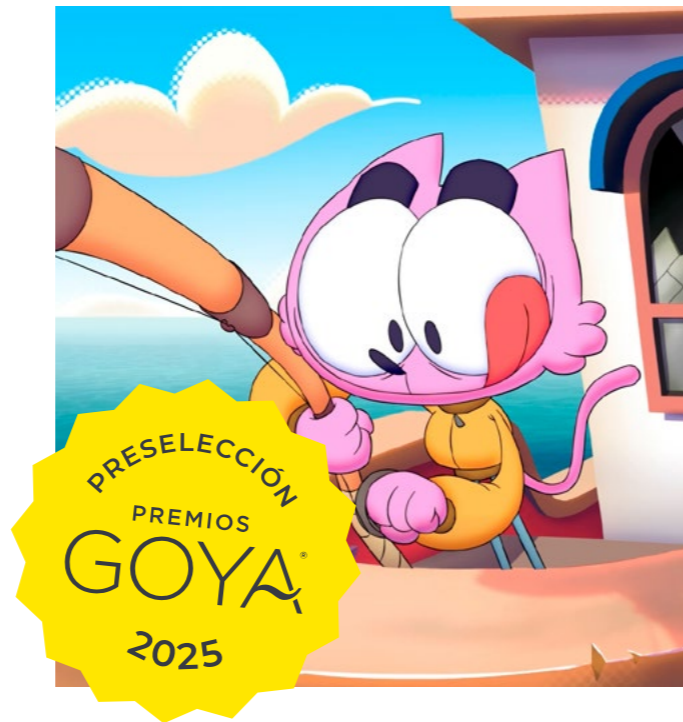
Cortometraje "Ciao Peskao" , preseleccionado a "Mejor Cortometraje de Animación" en los Premios Goya 2025.