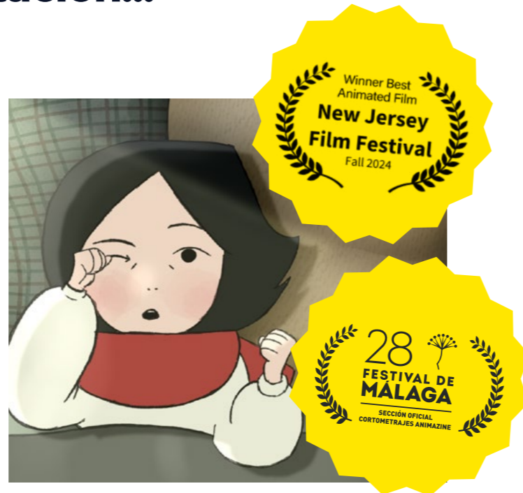
Cortometraje "Nieve Roja" , ganador del premio a la "Mejor Película de Animación" en el New Jersey Film Festival - Fall 2024 y nominado a "Mejor Cortometraje" en el Festival de Málaga 2025.